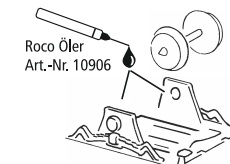
Roco Öl Art.-Nr. 10906

Les pièces de finition illustrées sont à monter par le modéliste. Le jeu de pièces peut comprendre d'autres pièces (non illustrées) qui sont destinées à autres versions du modèle et qui sont superflus à la variante présente.